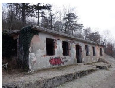
utrdb na Primožu nad Pivko