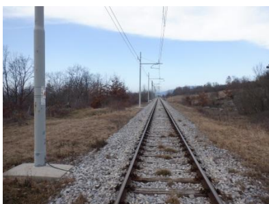
vozi nas vlak v daljavo

To pot se odpravljamo na Notranjsko, točneje v Pivko. Izstopili bomo na železniški postaji in se tik preden gre cesta skozi podvoz, odcepili od glavne ceste. Po lepi makadamski poti se bomo lagodno povzpeli do vojaških utrd na 718 m visokem Primožu. Lahko si bomo tudi »napolnili baterije« z malico iz nahrbtnika in na označenih energijskih točkah, ki jih je kar 22. Tako bomo pot na nekdanje gradišče Šilentabor, ki je služilo kot obramba pred Turki, opravili z lahkoto. Upajmo, da nam bo vreme naklonilo jasno nebo in si bomo lahko ogledali celoten Kras, Pivško kotlino, celo Julijske Alpe.