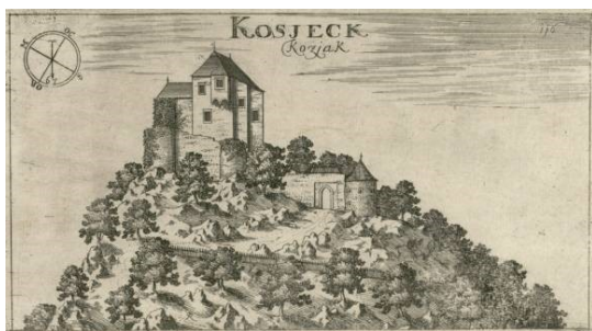
grad Kozjek - 13. stoletje

Avtobus nas bo zapeljal na izhodišče pohoda. V Dolenjih selcah bomo »vzeli pot pod noge«, se mimo razvalin nekdanjega gradu Kozjek, po gozdnih poteh spustili v Log ter se po mehkih travah dvignili do cerkvice Marije Magdalene v vasi Arčelca. Po malici in počitku bo sledila hoja do Gornjega Podšumberka in od tam še edini resnejši vzpon do razvalin gradu Šumberk.