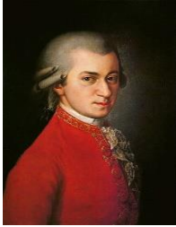
Wolfgang Amadeus Mozart

1.) V katero glasbeno obdobje spadajo spodnji skladatelji?