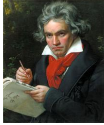
Ludwig van Beethoven