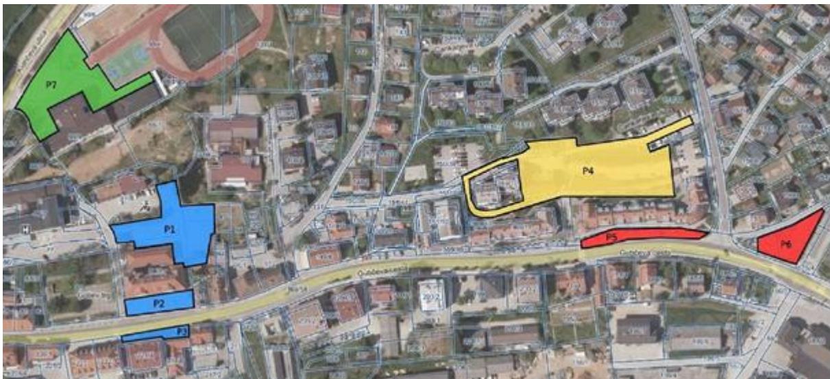
Slika 2: Območja parkiranja v Trebnjem