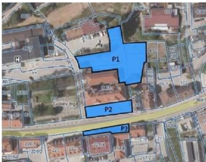
Slika 4: CIK-u najbližja plačljiva parkirišča P1 (za občinsko stavbo), P2 (pred občinsko stavbo) in P3 (nasproti občine)

Na javnih parkirnih površinah se od ponedeljka do petka od 7. ure do 17. ure plačuje parkirnina. Parkirnina se ne plačuje, če gre za praznik ali dela prost dan v Republiki Sloveniji. CIK-u najbližja plačljiva parkirišča so P1, P2 in P3 (slika 4).