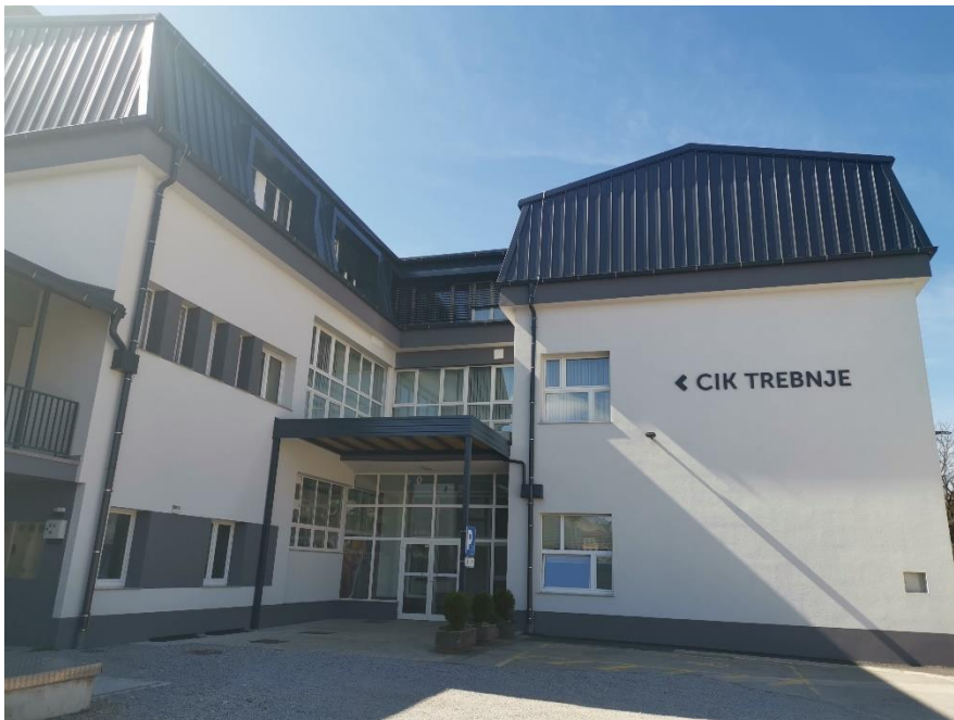
Slika 1: Vhod v stavbo CIK

Vhod v stavbo je iz zadnje strani, v smeri športnega parka Trebnje.