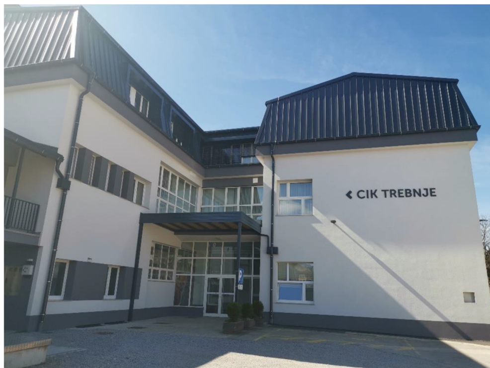
Slika 1: Vhod v stavbo CIK

Vhod v stavbo je iz zadnje strani, v smeri športnega parka Trebnje.