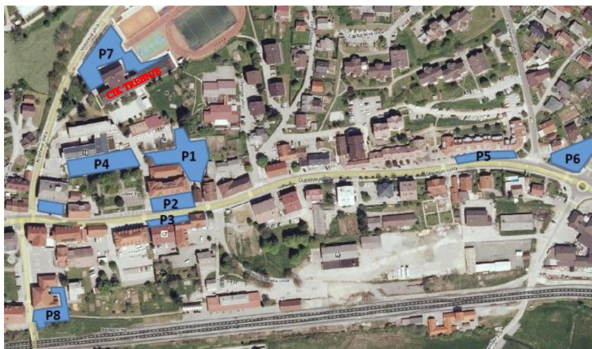
Slika 2: Območja parkiranja v Trebnjem